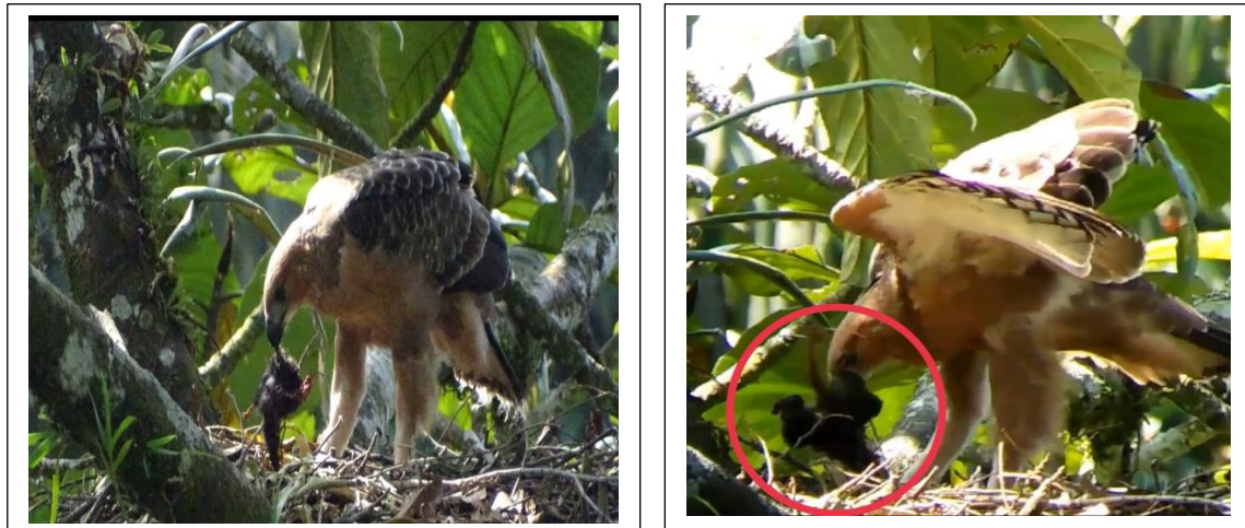
Gambar 3. Burung Elang Jawa yang sedang mencacah makanannya di sarang

Selama pengamatan terhadap jenis pakan Elang Jawa, Tupai ditemukan dalam jumlah terbanyak yaitu 10 ekor. Tupai adalah mamalia kecil yang mirip, dan kerap dikelirukan, dengan bajing. Tupai adalah pemangsa serangga, dan dahulu dimasukkan ke dalam kelompok insektivora (pemakan serangga), sedangkan bajing termasuk kelompok Rodentia (hewan pengerat) bersama-sama dengan tikus. Tupai menjadi salah satu jenis pakan yang dikonsumsi Elang Jawa, karena dilihat dari ukuran tubuhnya yang kecil yang memudahkan burung Elang Jawa untuk memangsanya. Jenis pakan terbanyak kedua (7 kali) yang ditemukan adalah Kadal atau bengkabung adalah kelompok reptilia bersisik dan berkaki empat, umumnya bertubuh kecil, padat, bersisik licin dan mengkilap serta hidup di tanah. Kadal merupakan salah satu reptil sebagai pakan Elang Jawa sesuai dengan hasil penelitian Alfiyasin dkk., (2018) yang dilakukan di Bukit Mayana