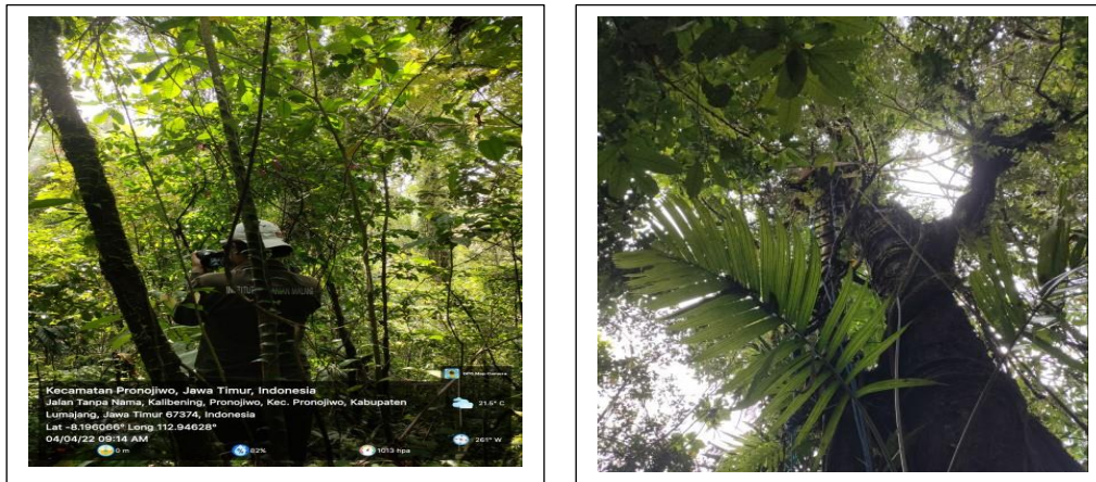
Gambar 2. Lokasi pengamatan di Jurang Kinten dan pohon sarang

Pengamatan pakan pada sarang dilakukan dengan menggunakan teropong, serta pengamatan pada serpihan pakan yang jatuh dibawah pohon dilakukan secara langsung, lama pengamatan 31 hari, jenis pakan yang ditemukan baik secara tidak langsung dengan menggunakan teropong maupun secara langsung melalui serpihan yang jatuh dibawah pohon sarang seperti disajikan pada Tabel 1.